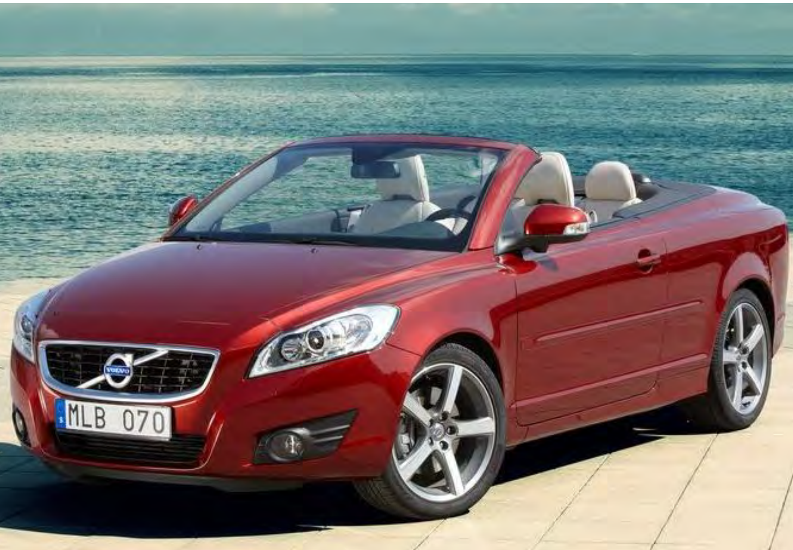
Volvo C70 | 2009 | ZK-459-S