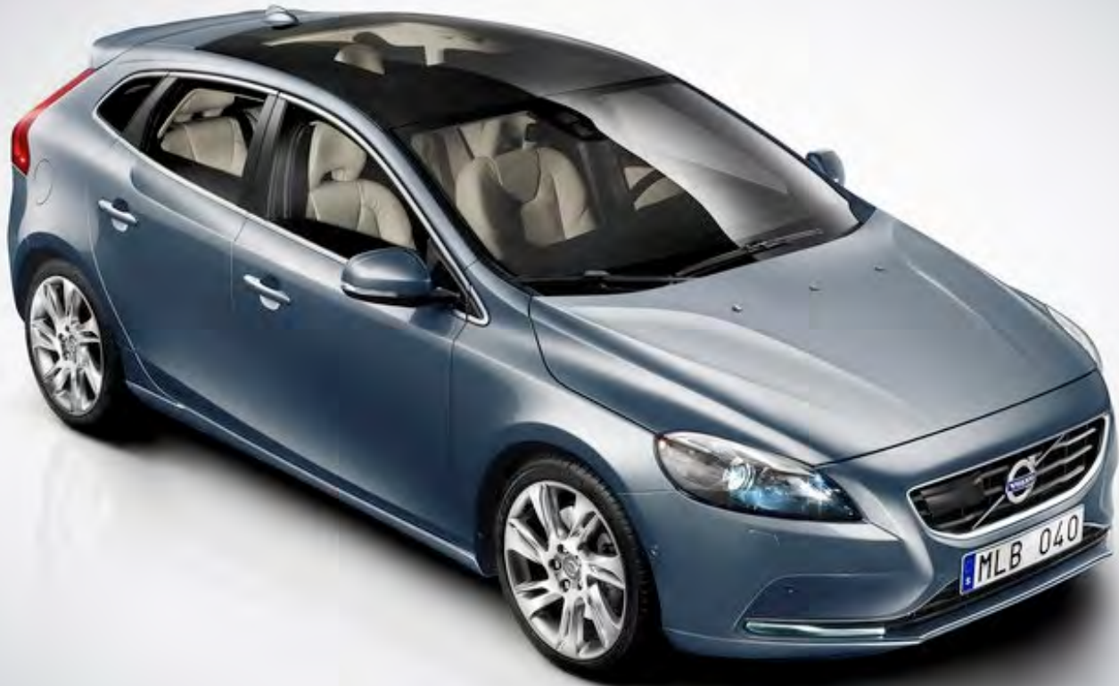
Volvo V40 | 2012 | ZH-565-G