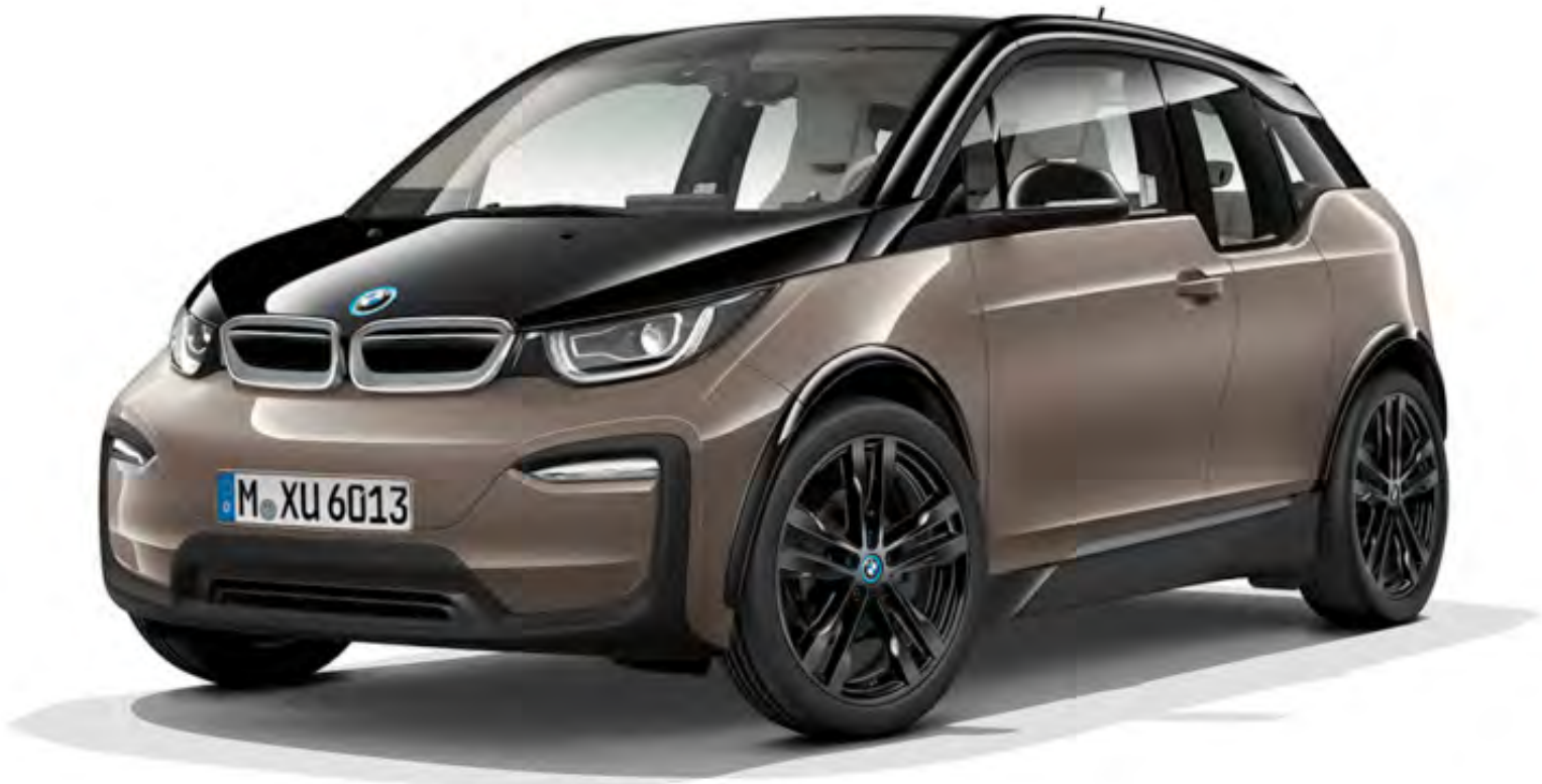
BMW i3 | 2013 | XL-324-P