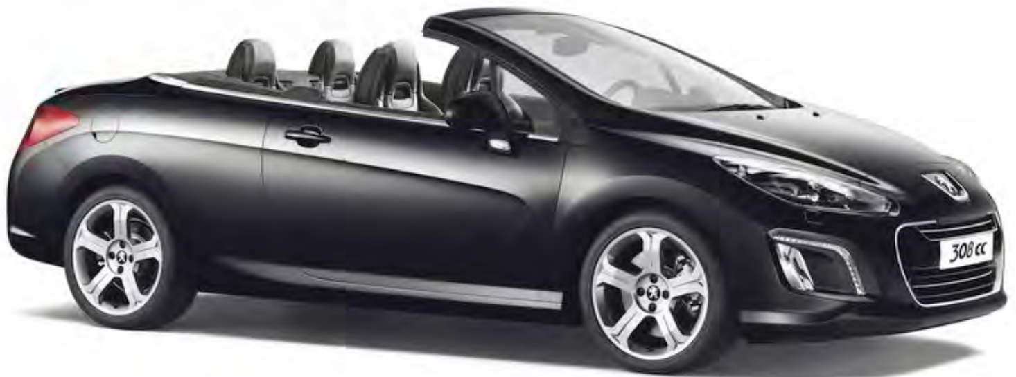
Peugeot 308 CC | 2009 | 7-XRL-33