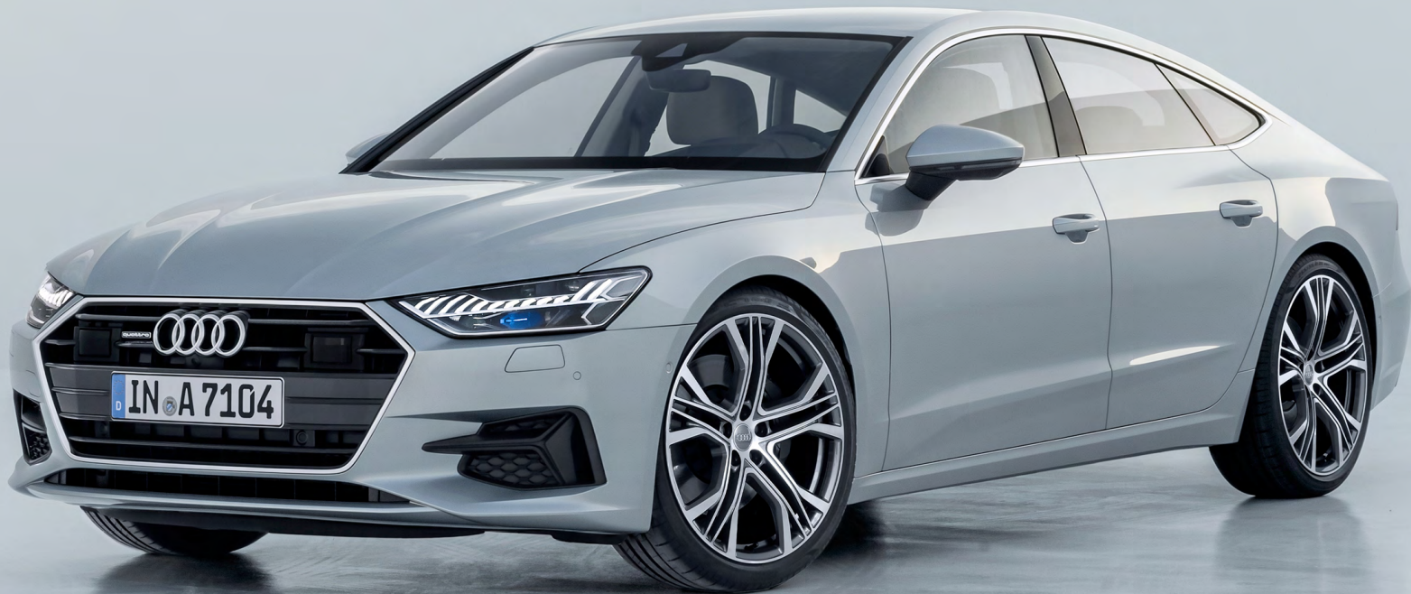
Audi A7 | 2018 | XF-692-X