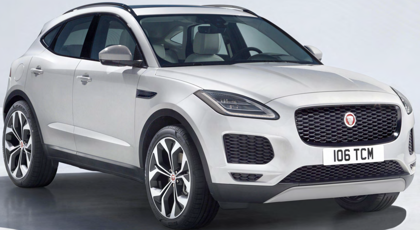
Jaguar E-Pace | 2018 | TS-911-L