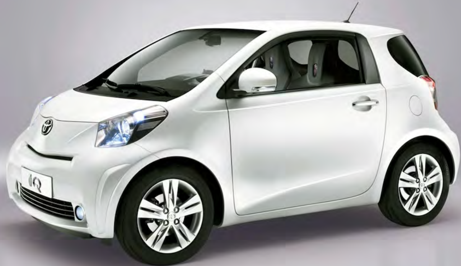
Toyota iQ | 2009 | 82-NPV-2