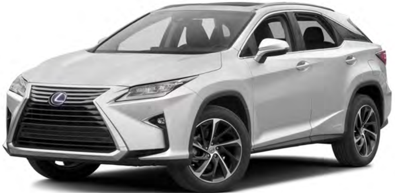
Lexus RX 450h | 2018 | SF -371-S