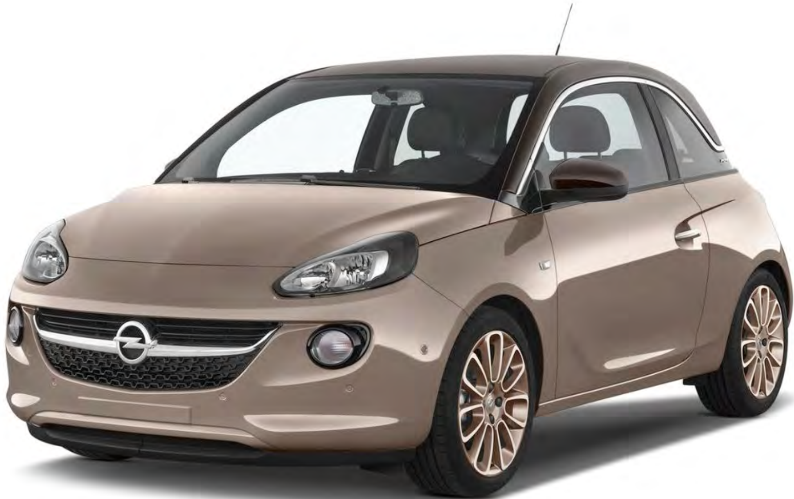
Opel Adam | 2013 | 70-ZVK-5