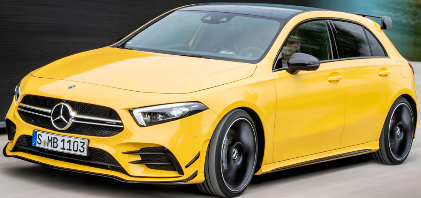
Mercedes-Benz A-Klasse | 2018 | XJ-485-Z