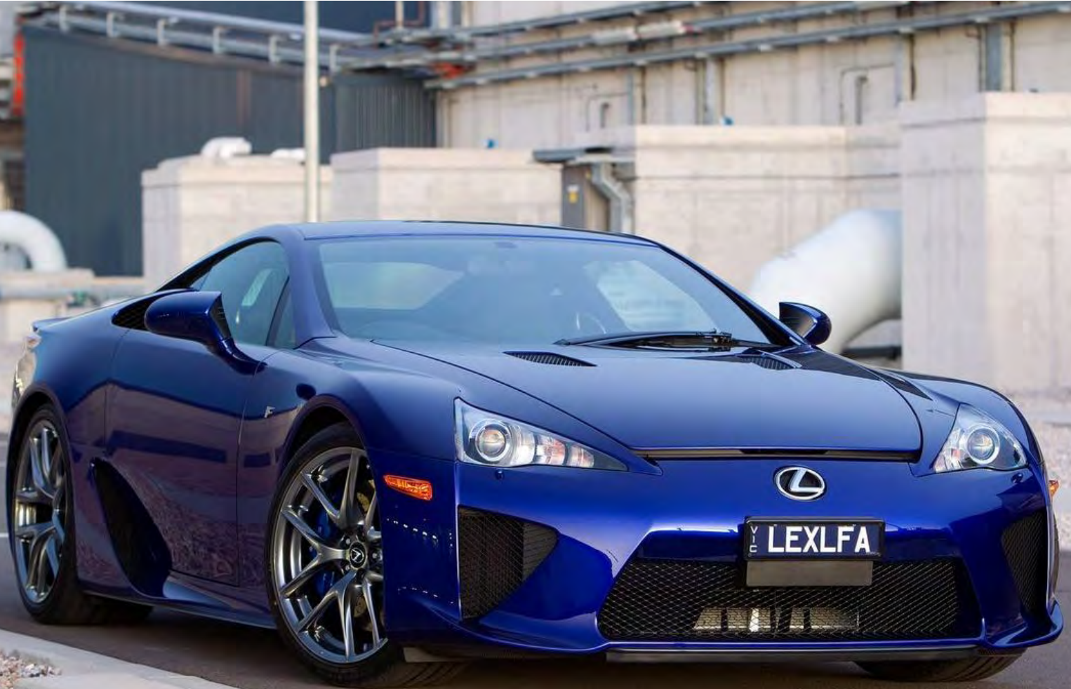
Lexus LFA | 2010 | 16-ZRN-9