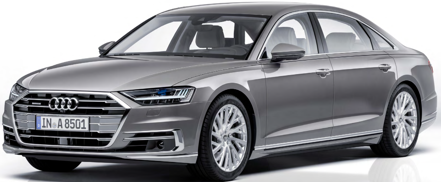
Audi A8 | 2017 | XH-658-T